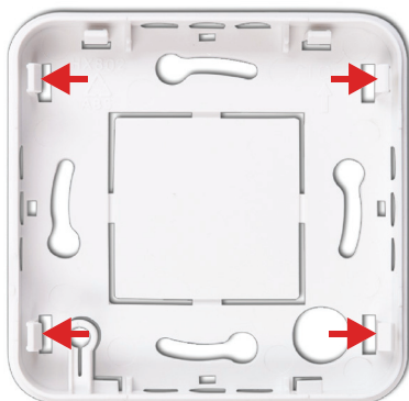
Obrázek 2: Spodní kryt