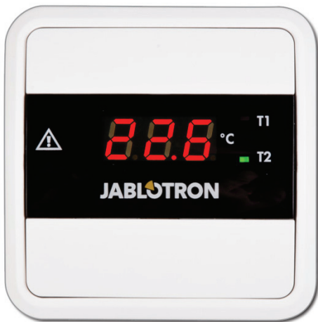
Obrázek 1: Přední pohled

Elektronický teploměr TM-201 lze využít ve všech instalacích, kde je potřeba měřit a zobrazovat jednu až dvě teploty. Tyto teploty jsou zobrazovány na přehledném displeji, kde je pomocí zelených LED zároveň indikováno, ze kterého teplotního snímače je aktuálně zobrazovaná teplota.